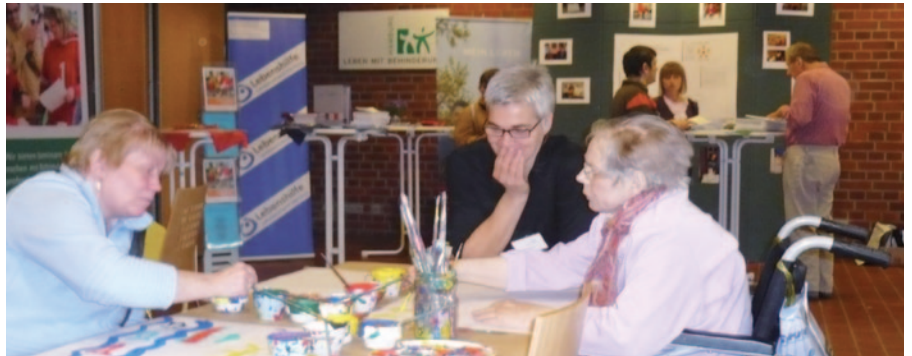
Die Angebote beim Lernfest der Erwachsenenbildung wurden gut angenommen.

Viel Spaß machten den Besuchern die unterschiedlichen Stände, an denen Kursleiter, zum Teil mit Unterstützung engagierter Teilnehmer, ihre Angebote vorstellten und