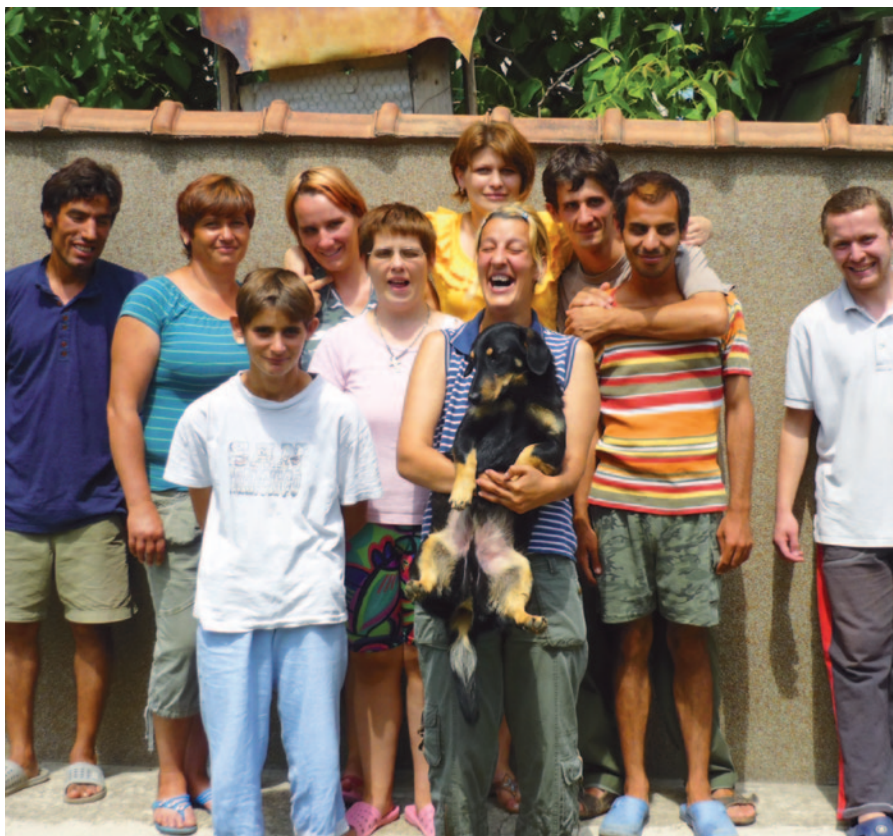
Die Bewohner von Sacueni freuen sich über ihr neues Zuhause.

Die Bewohner besuchen reguläre Schulen, lernen einen Beruf oder gehen regelmäßig arbeiten. Konzepte für individuelle Unterstützung werden mit deutscher Hilfe entwickelt. Arbeitsassistenten werden von der Hamburger Arbeitsassistenz ausgebildet, dezentrale