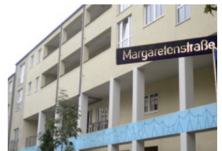
Wohnen im Schanzenviertel

Ziel des Wohnprojektes ist es, seinen Nutzern individuelle Unterstützung durch persönliche Assistenz zu ermöglichen und dabei Gemeinschaft und ein aktives Leben im Stadtteil